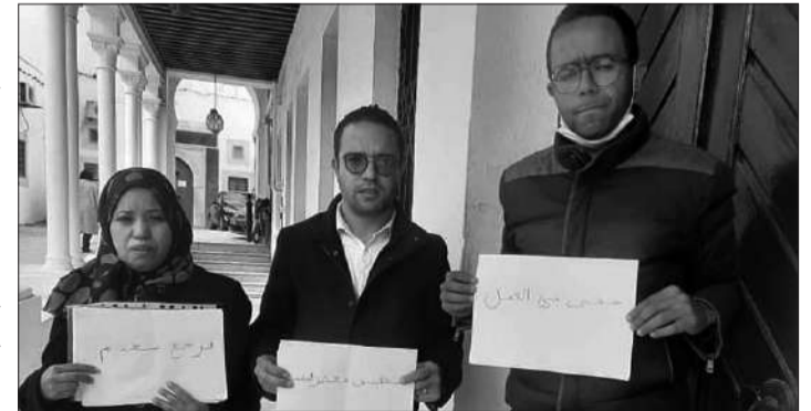
*اعتصام المكلفين بالإعلام

ينفذ عدد من المكلفين بالإعلام والاتصال بالوزارات وبالمؤسسات العمومية والجماعات المحلية اعتصاما أمام مقر رئاسة الحكومة بالقصبة احتجاجا على انقلاب الحكومة على اتفاق سابق أبرمته مع الهياكل النقابية القطاعية بالاتحاد العام التونسي للشغل في نوفمبر 2020 يقضي بتسوية وضعياتهم المهنية.