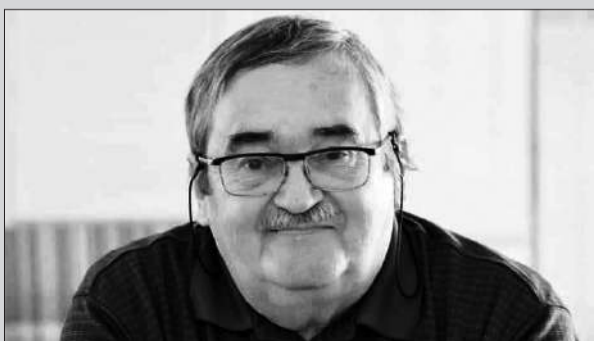
والأصدقاء في هذا المصاب الجلل إننا لله وإنا إليه راجعون

- يمكن أن يكون الانقاذ في سنة واحدة - قد يقول