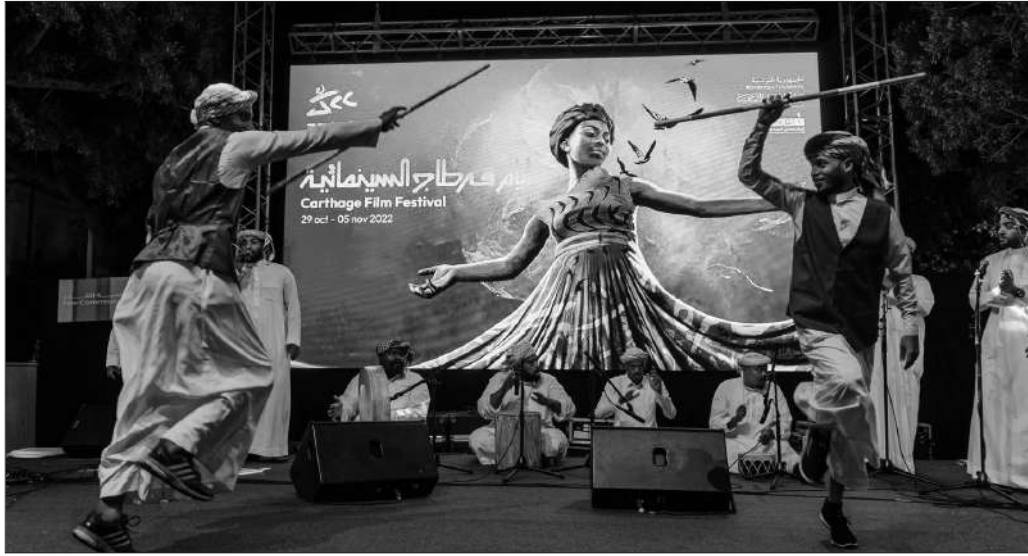
مشهد من الافتتاح في شارع الحبيب بورقيبة

التكريم الأبرز هذا العام للممثل الراحل هشام رستم الذي أسهم طوال حياته في بناء صرح الفن السابع في تونس وفرنسا وفي المسرح بمحصلة 80 مسرحية في فرنسا وتونس و32 شريطا سينمائيا تونسيا وعالميا وهو الذي توفي في جوان 2022 بعد أن أفنى حياته في خدمة الثقافة التونسية كنجم سيخلد في الذاكرة الوطنية. جديد هذه الدورة هو مهرجان أفلام روائية ووثائقية لسينما الأطفال بالجهات للعرض بقاعات قابس وجربة وغار الملح بنقاشات مع صانعي الأفلام والنقاد. ضمن هذا الخضم من السينما لا يمكن تجاهل معرض عن «فريدريكو فليني» وعرض عدد من أفلامه خلال الأسبوع وهو صانع الأفلام الإيطالي الذي ترك بصمة إبداعية لا تضاهى في تاريخ وثقافة الفن السابع.