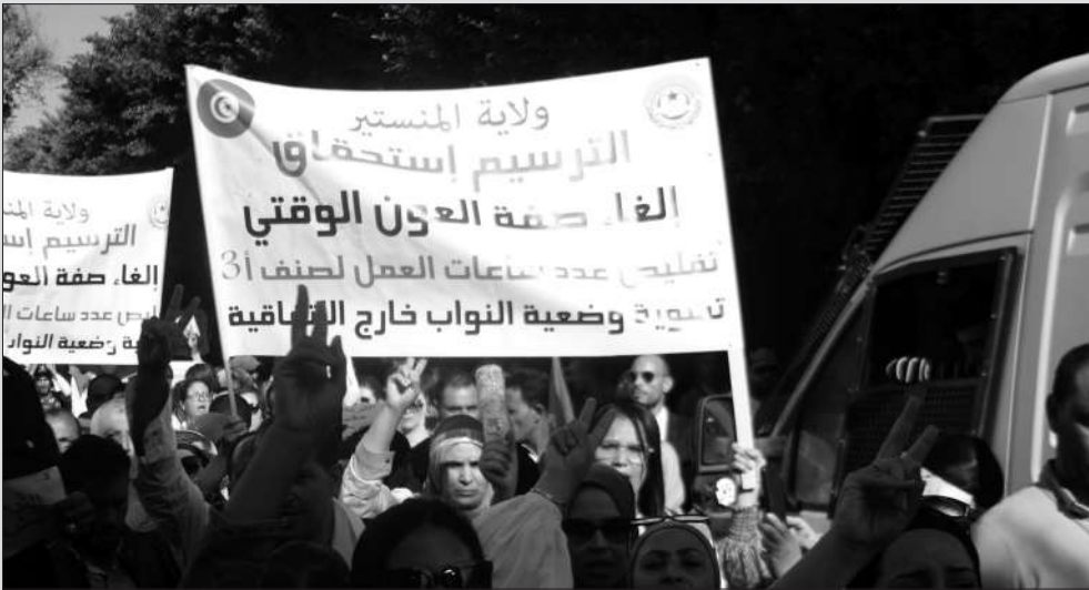
مشهد من الوقفة الاحتجاجية للقطاع أمام وزارة التربية

نحن أعضاء لقاء الجهات لقطاع التعليم الأساسي المجتمعين يوم 1 نوفمبر 2022 بدار الاتحاد الجهوي للشغل بتونس إذ نجدد اعتزازنا بالانتماء إلى منظماتنا العتيبة الاتحاد العام التونسي للشغل بإرثها النضالي وتوجهها التقدمي وافتخارنا بقطاعنا الأبي، فإننا نتوجه بتحية نقابية خاصة إلى ضحايا التشغيل الهش وكافة الزميلات والزملاء وجميع الهياكل النقابية القطاعية على حسن إدارتها للملحمة النضالية التي خاضها القطاع ضد أشكال الاستعباد الجديدة التي يراد تيريرها إنفاذا لإملاءات صندوق النقد الدولي. ويسجل لقاء الجهات: