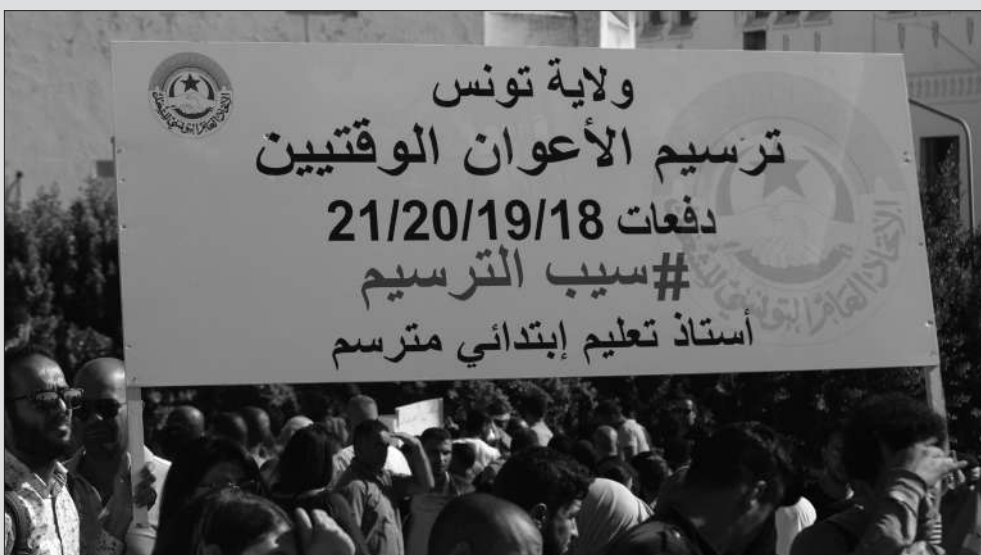
لا للعودة إلى العمل الهش