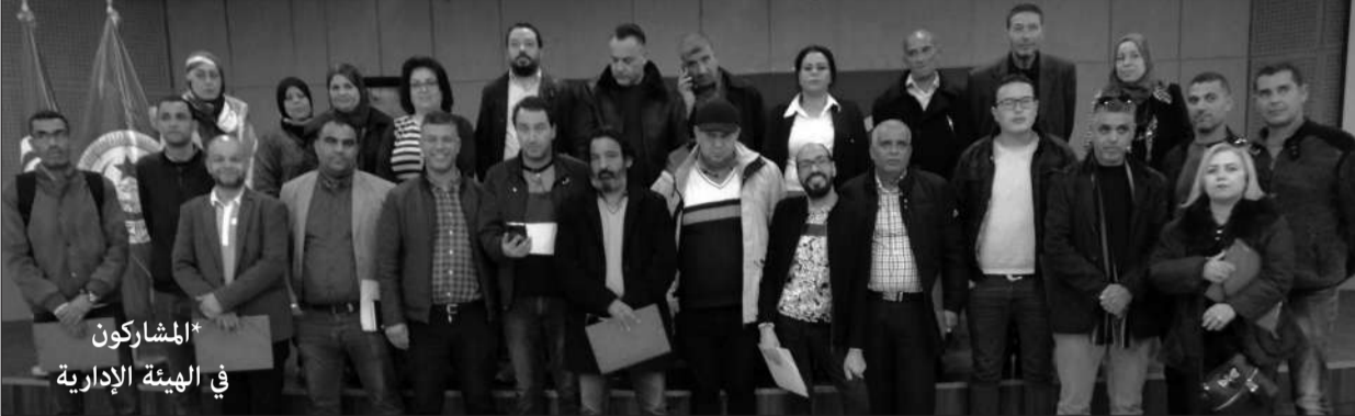
* المشاركون في الهيئة الإدارية