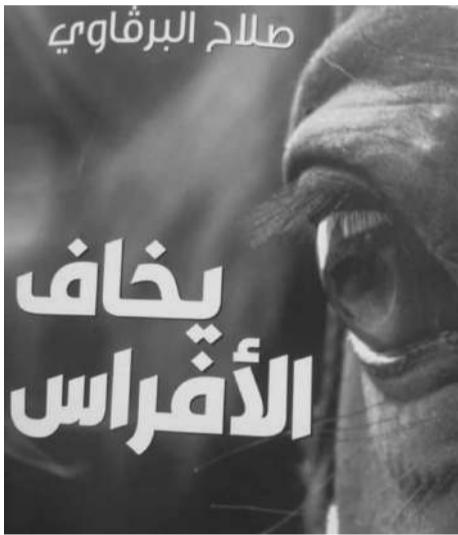
صلاح البرقاوي يخاف الأفراس

ومرّ أمامك شريط حياتك محملاً بكبرى المحطات.. ههنا لحظة خوف.. هناك خديعة.. من هنا عصا على رأسها جزر.. من حولك صحو وأنواء.. دماء وأشلاء.. خاضت روحك كل هذا المدى.. سقطت ونهضت مرات.. فرحت وحزنت مرات.. نجحت وفشلت مرات.. الآن ما كان فات.. وما هو آت آت.. تسأل روحك الغاربة عما قد تكون قدمته من تنازلات من أجل مركز أو لقمة أو فتات.. عما أهدرت من شرف أو كرامة أو مبادئ أو شهامة.. هل كان ذلك لائقاً بك.. هل كنت محتاجاً إلى التنازل؟ ومن أجل ماذا في النهاية؟ ومن يعتقد أن اللحظة لا تزال بعيدة، ليغض عينيه.. الغد على مرمى طرفه عين. رواية يخاف الأفراس لصاح البرقاوي رواية الروايات لسنة 2022.