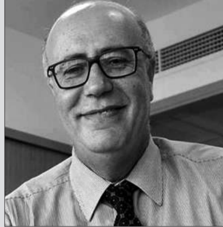
* مروان العباسي

محافظ البنك المركزي يعطي فقط الأوامر ويطلب الحكومة وكأنه خارج السفينة وهو ويتسلح دائما باستقلالية البنك المركزي. فيلّي متى يتواصل نشير غسيل الخلاف بين الحكومة ومحافظ البنك المركزي ولصالح من؟