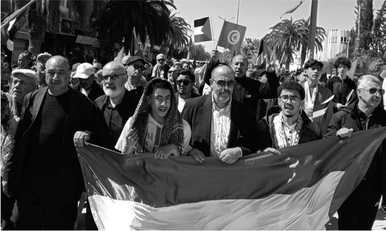
مشهد من الوقفة التضامنية مع غزة

للاطلاق في تهيئة وحدات إنتاج إضافية سوف تخلق قرابة 2000 موطن شغل جديد بحجم استثمارات تناهز 91 مليون دينار مما يعزز النسيج الاقتصادي لولاية جندوبة.